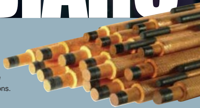
Poids de métal enlevé par longueur d'électrode consommée.

Les électrodes de gougeage TEAM BINZEL sont composées de carbone synthétique avec un enrobage de cuivre. Un grand nombre de formes et de diamètres différents sont disponibles pour couvrir tous les types d'applications.